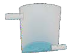
Toma de muestras